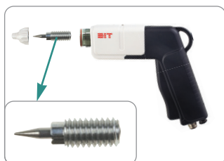
간단한 청소 및 유지관리 Easy cleaning and maintenance