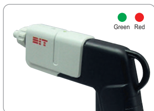
알람 출력 기능 High voltage alarm output